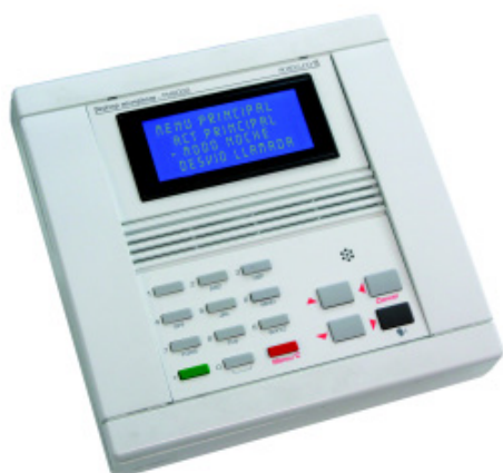
Centrale de poste infirmier P6000 permet de relier jusqu'à 99 chambres